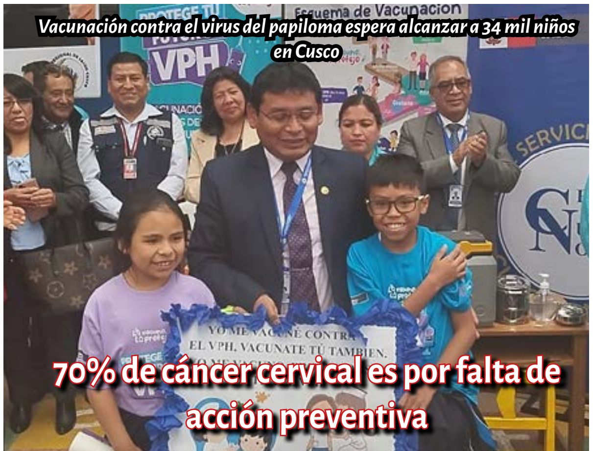
Vacunación contra el virus del papiloma espera alcanzar a 34 mil niños en Cusco