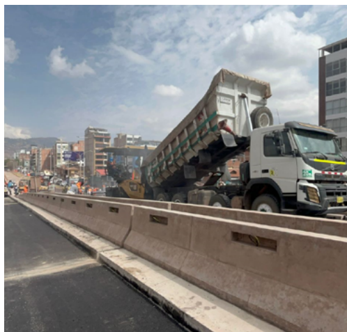
5 de setiembre de 2024 13:5329S 71:9563W Vía expresa