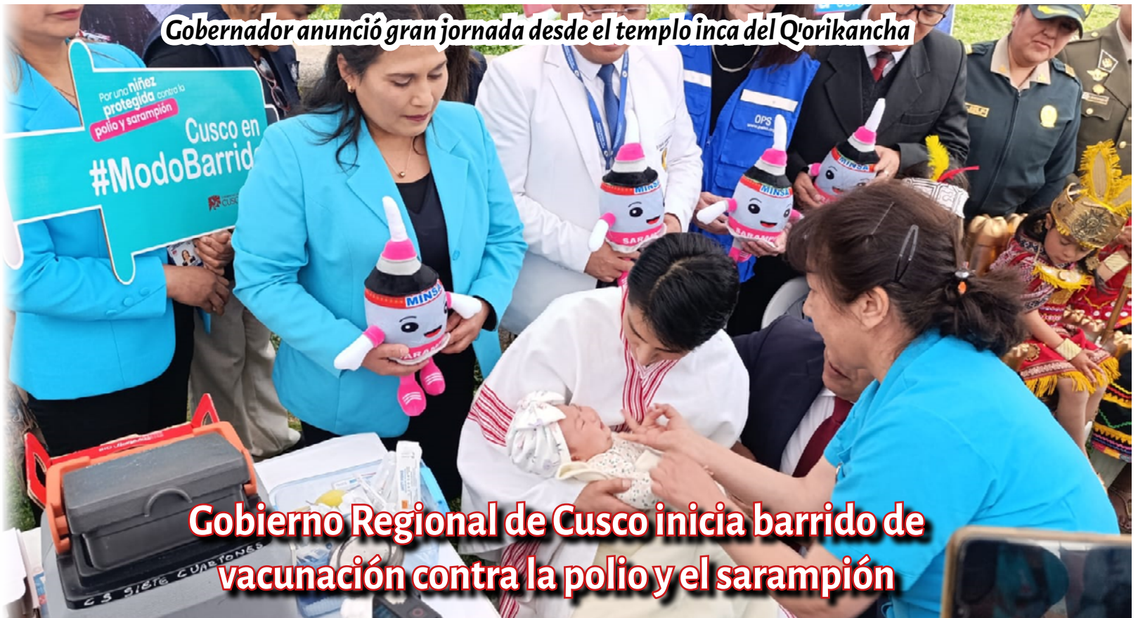
Gobernador anunció gran jornada desde el templo inca del Qorikancha