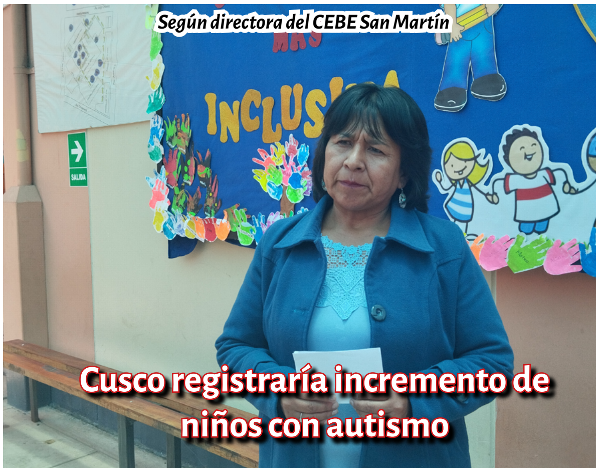
Según directora del CEBE San Martín