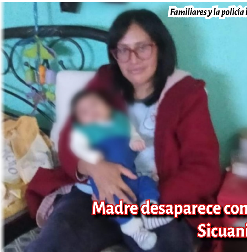
Familiares y la policía intensifican la búsqueda