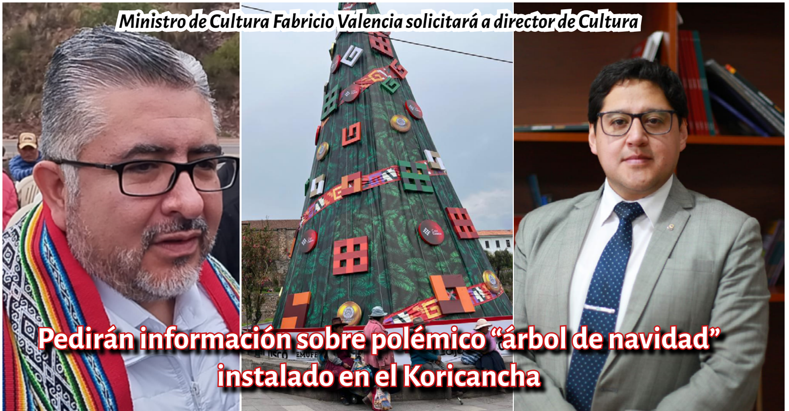
Ministro de Cultura Fabricio Valencia solicitará a director de Cultura